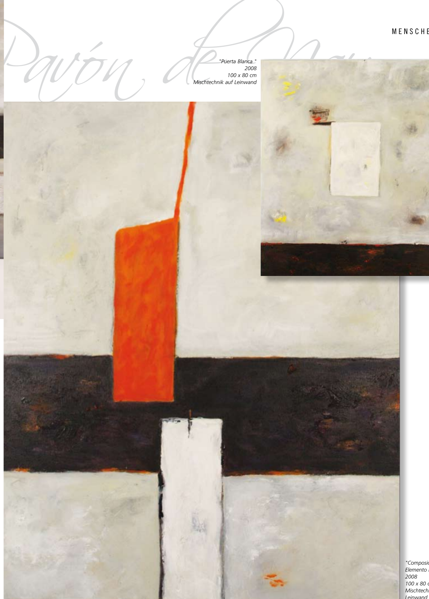
"Puerta Blanca." 2008 100 x 80 cm Mischtechnik auf Leinwand

Eine deutsch-mexikanische Künstlergruppe hat Gabriela Pavón ins Leben gerufen, die 2009 in Köln und im darauf folgenden Jahr in Mexiko mit Symposien und Workshops den künstlerischen Austausch pflegen will.