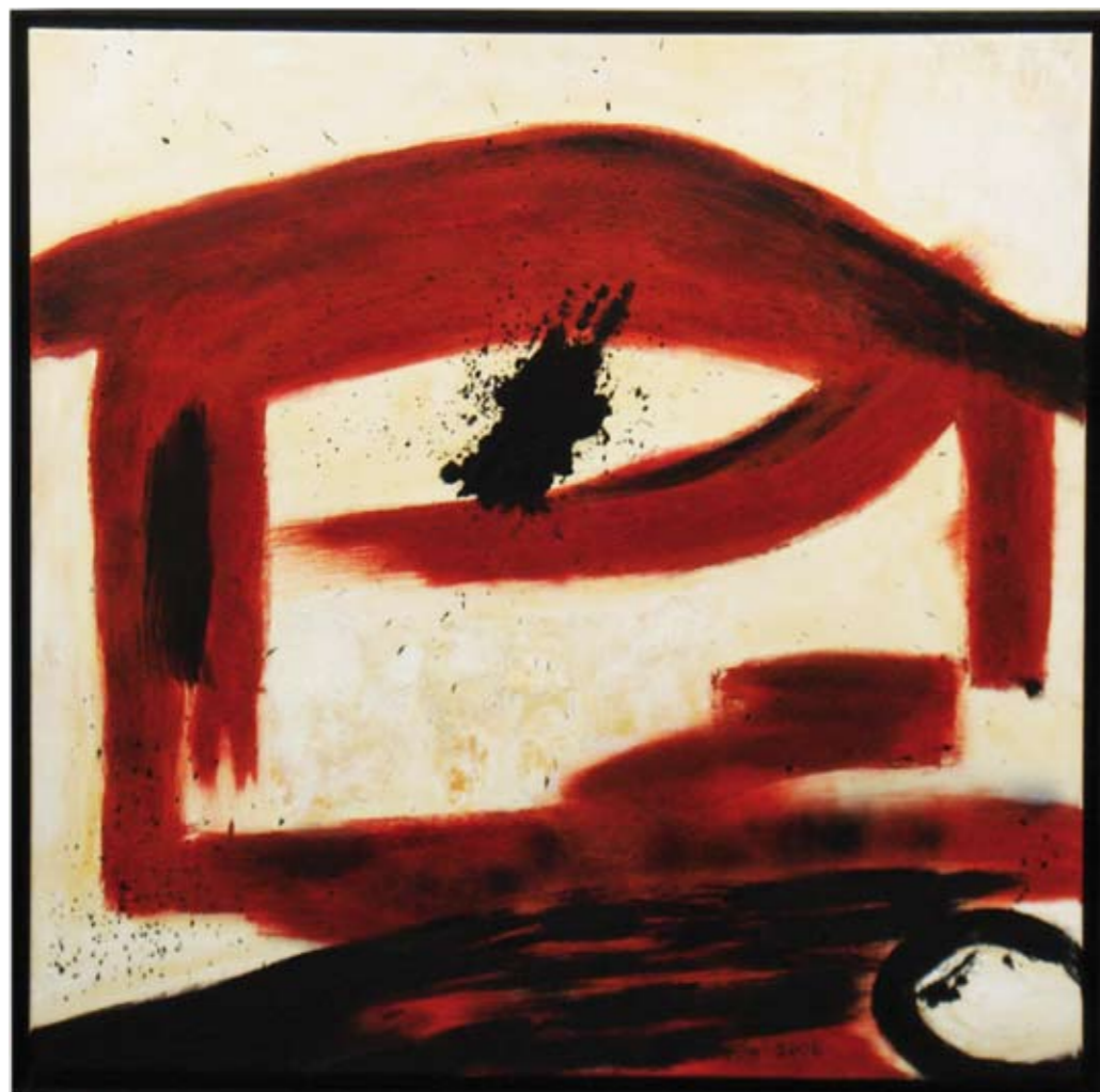
"Tu Casa" 2006 100 x 100 cm Mischtechnik auf Leinwand