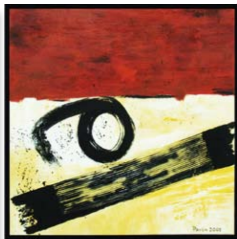
"Santa Fe" 2005 100 x 100 cm Mischtechnik auf Leinwand