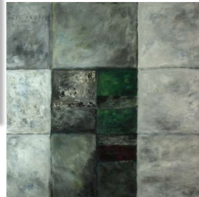
"Mirando la Selva" 2008 120 x 120 cm Mischtechnik auf Leinwand