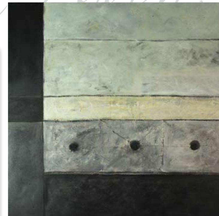
"Kabah" 2008 120 x 120 cm Mischtechnik auf Leinwand