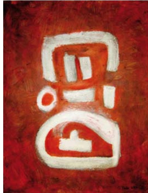
"La Mona" 2004 120 x 100 cm Mischtechnik auf Aluminium