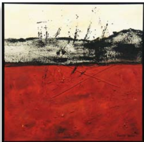
"Erupción" 2006 100 x 100 cm Mischtechnik auf Leinwand