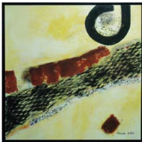
"Frontera" 2006 100 x 100 cm Mischtechnik auf Leinwand