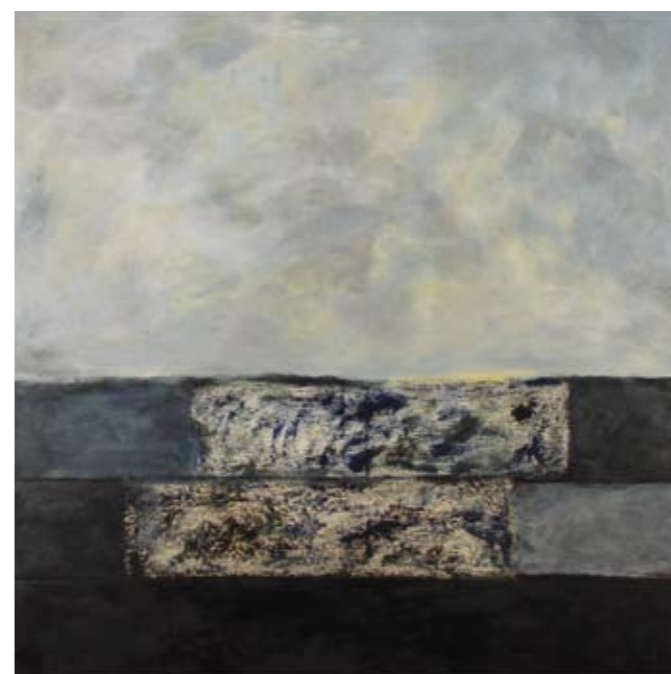
"Llegada al Cielo" 2008 120 x 120 cm Mischtechnik auf Leinwand